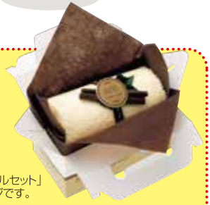
「ミニロールタオルセット」 ※画像はイメージです。