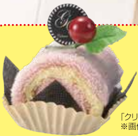
「クリームロールタオル」 ※画像はイメージです。

「クリームロールタオル」または 「ミニロールタオルセット」 どちらか1つプレゼント